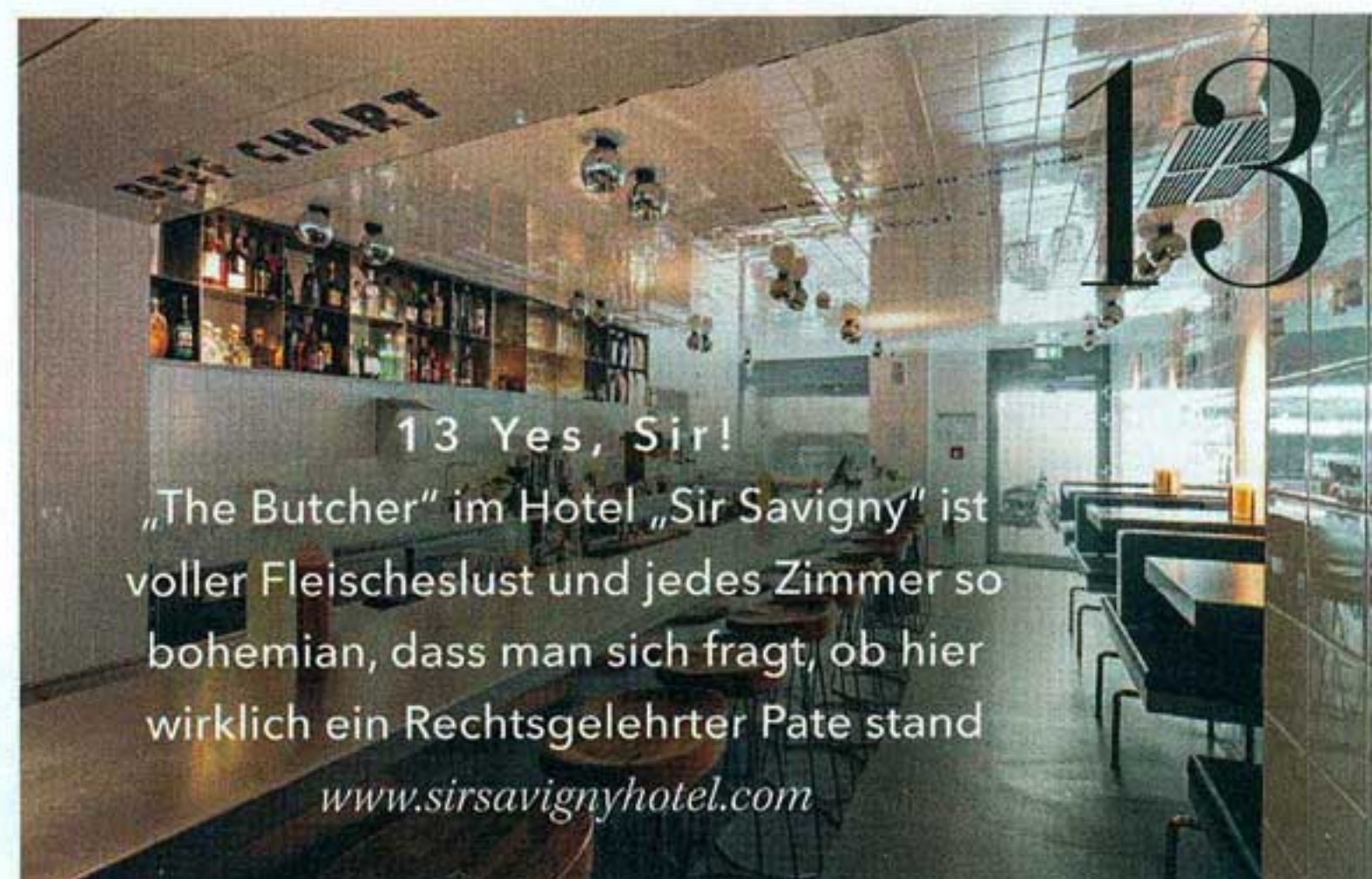
13 Yes, Sir! „The Butcher“ im Hotel „Sir Savigny“ ist voller Fleischelust und jedes Zimmer so bohemian, dass man sich fragt, ob hier wirklich ein Rechtsgelehrter Pate stand www.sirsavignyhotel.com