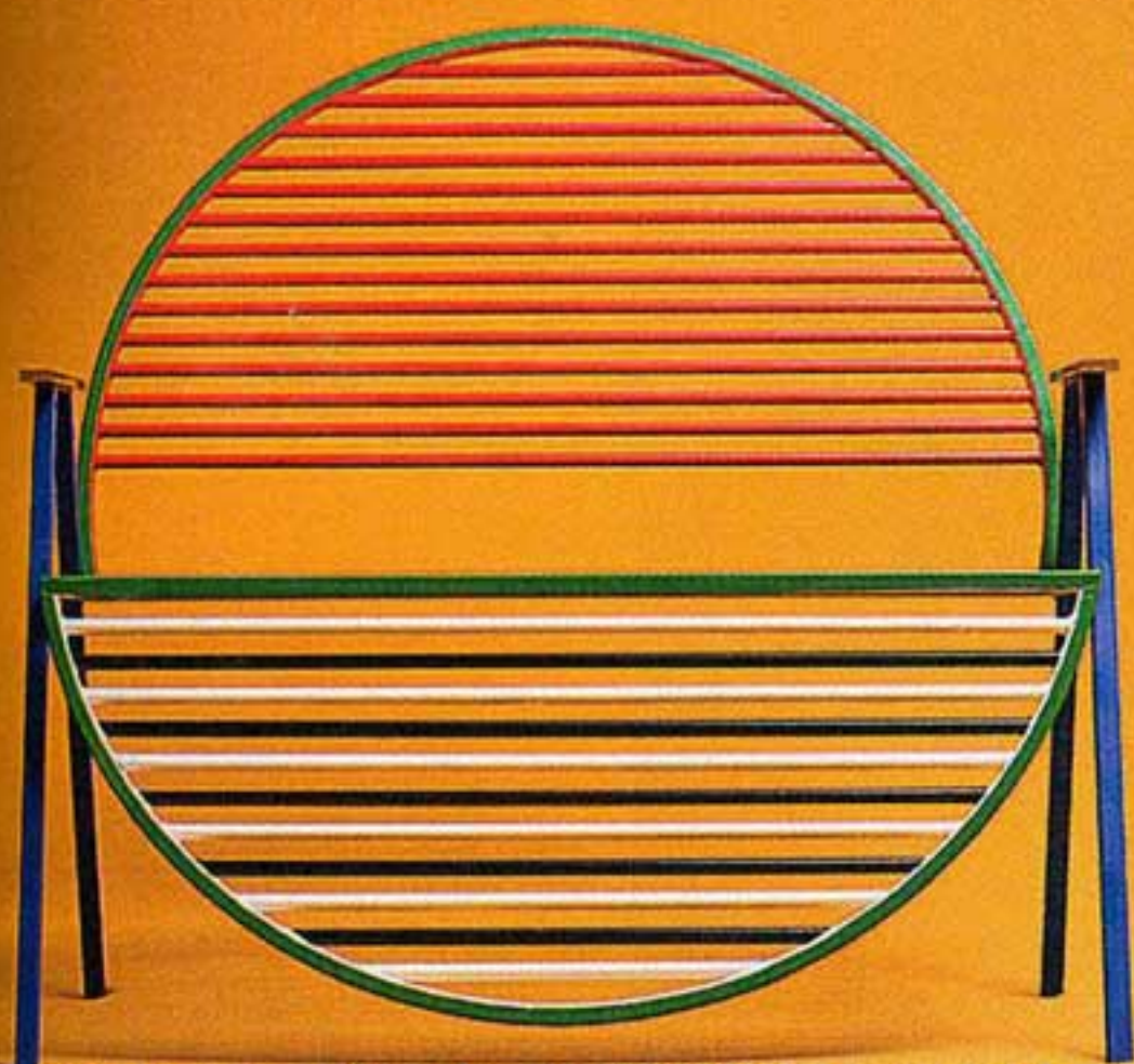
2 Her mit dem Sundowner! Nicht nur für Grafiker ein Lieblingsplatz: Bank „Bob“, ca. 3900 Euro www.kevinhviid.com