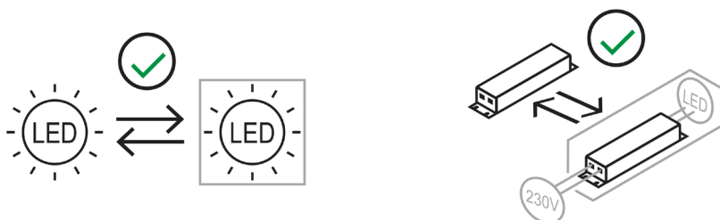
Lichtquelle (nur LED)

Kann vom Endverbraucher ausgetauscht werden