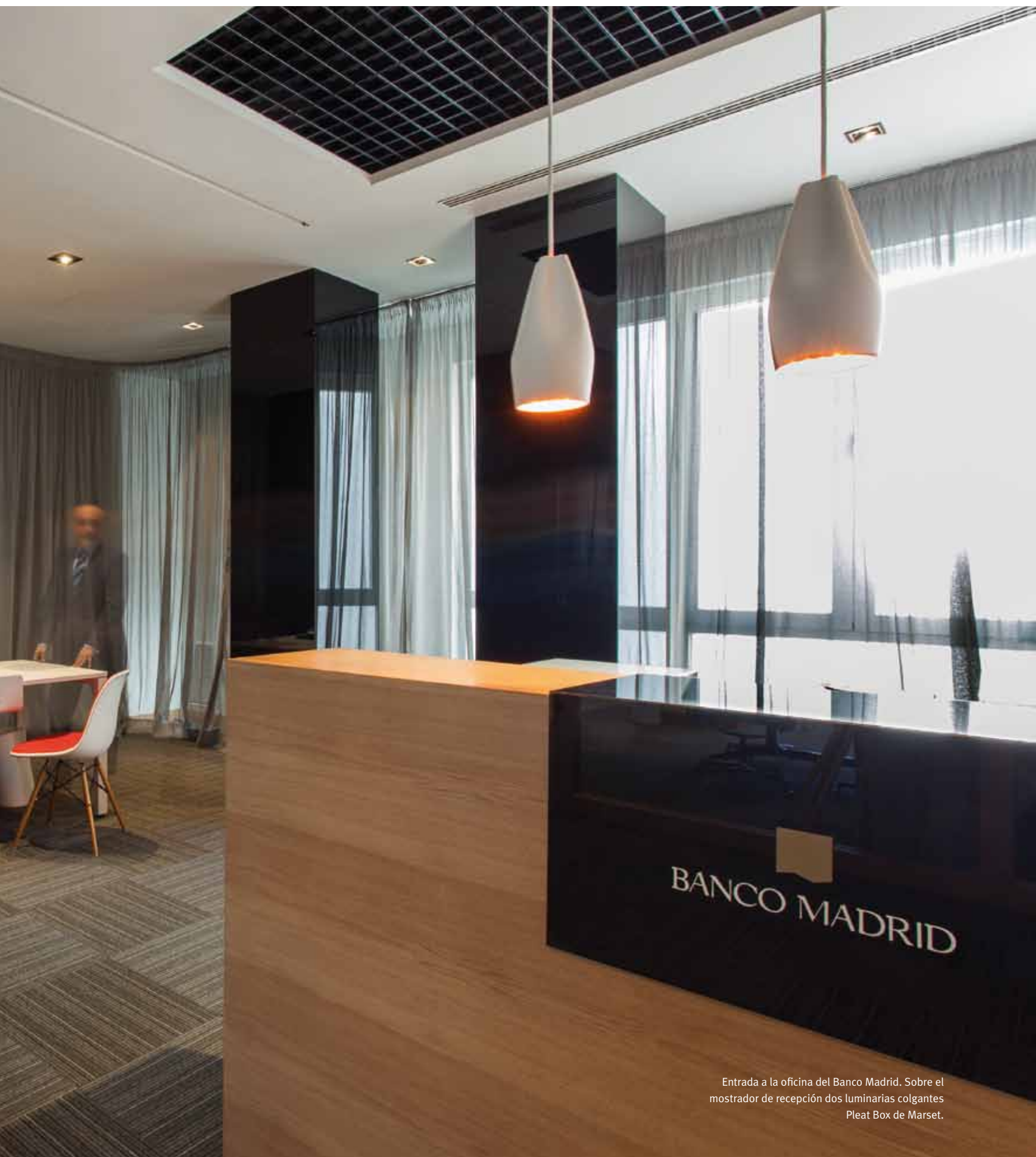
Entrada a la oficina del Banco Madrid. Sobre el mostrador de recepción dos luminarias colgantes Pleat Box de Marset.